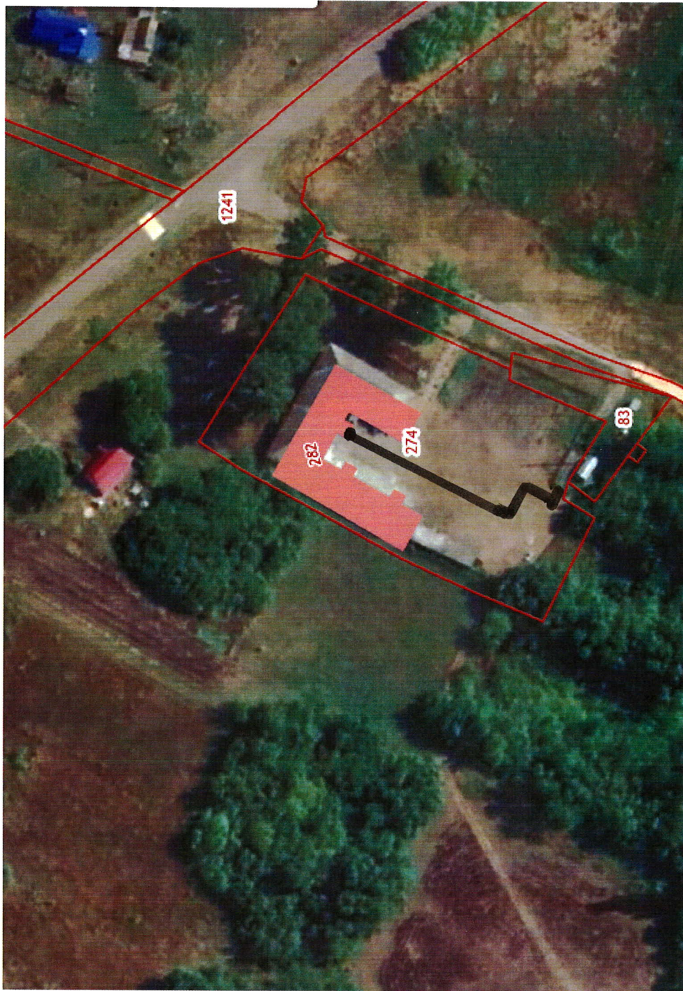
Схема теплоснабжения Верхнеплавицкого сельского поселения Верхнехавского муниципального района Воронежской области